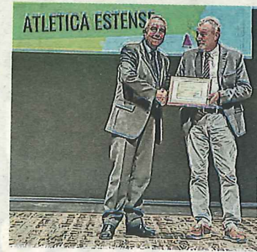
Gli Oscar stagionali