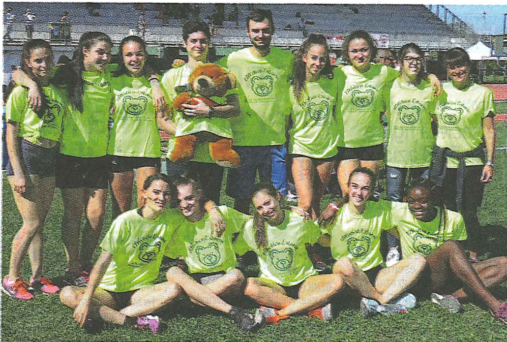
L'under 18 femminile dell'Atletica Estense alla finale B nazionale a Modena del campionato a squadre

Tostissime le altre dodici formazioni presenti a Modena, a rappresentare Emilia Romagna, Marche, Piemonte, Valle d'Aosta, Veneto e Toscana, con l'Atletica Empoli che risulterà la società vincitrice al termine delle venti gare del programma tecni-