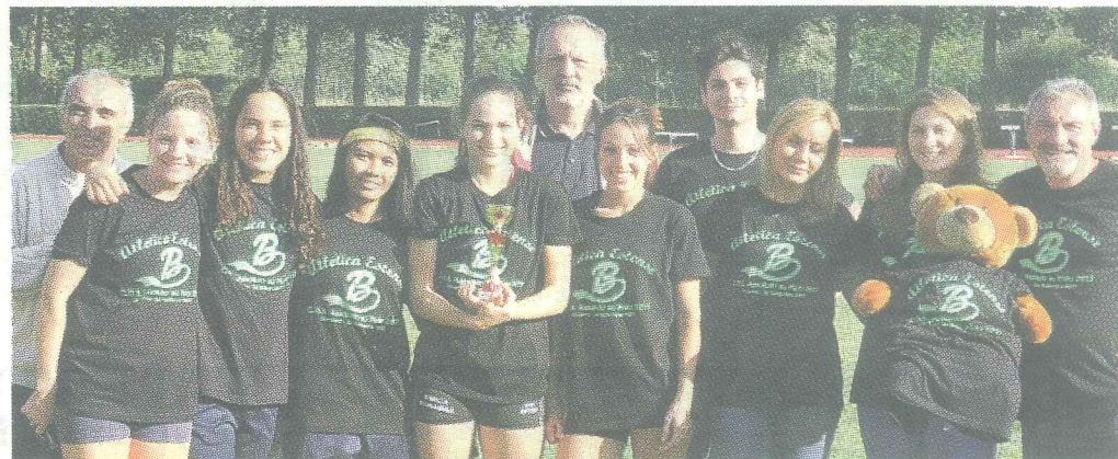
La squadra dell'Atletica Estense alla finale nazionale B di Ravenna

Ma veniamo ai risultati delle ferraresi. Ancora sugli scudi per