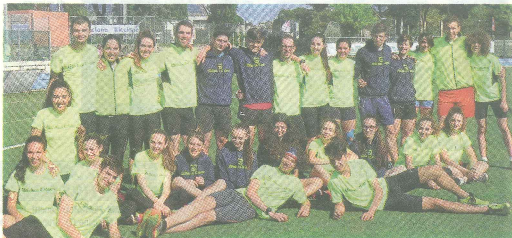
Il gruppo di Atletica Estense che ha partecipato allo Spring Campus di Riccione

Il classico "Natale con i tuoi e Pasqua con chi vuoi" è più che mai la frase che da sei anni identifica lo "Spring Campus" di Aletica Estense; lo stage societario che si svolge durante le vacanze pasquali e finalizzato non solo alla preparazione agonistica, ma un'occasione di socializzazione completa che passa dal campo di atletica, alla spiaggia, agli indigesti compiti scolastici per le vacanze. Riccione ha accolto gli oltre trenta partecipanti tra atleti e staff tecnico con giornate assolate che hanno esaltato la voglia di