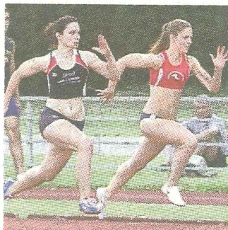
A tutto sprint nel meeting