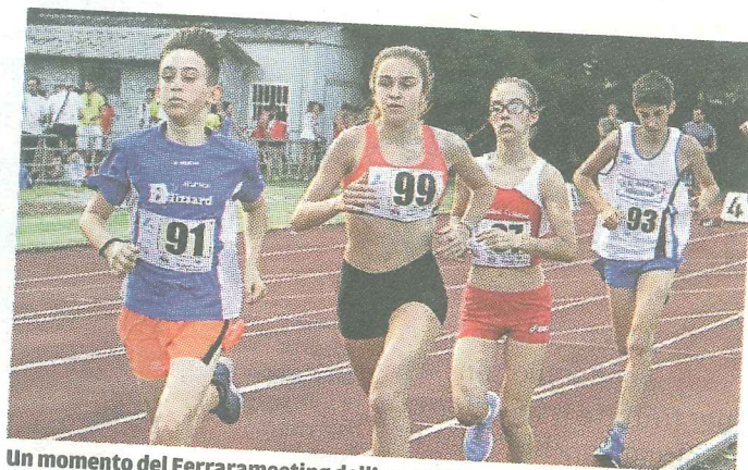
Un momento del Ferrarameting dell'anno scorso