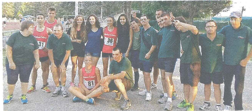
I ragazzi della cooperativa sociale La Città Verde