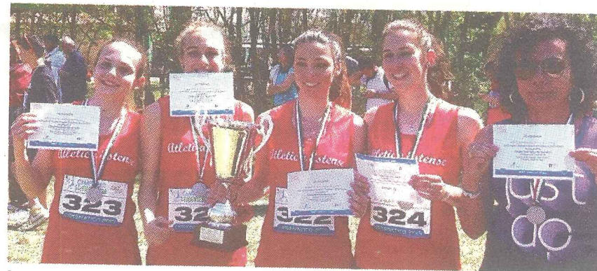
Le quattro ragazze del "Roiti" e la loro insegnante con la medaglia d'argento al collo

sugli spalti del campo scuola dai compagni e compagne dell'Atletica Estense: se la vittoria regionale era valsa una torta, questa volta ci vorrà molto di più.