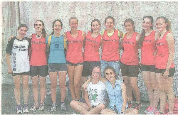
Il gruppo di atlete ferraresi in gara

Atletica Verso le finali nazionali a settembre