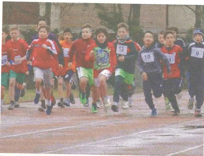
Un'immagine della partenza maschile degli aspiranti mezzofondisti