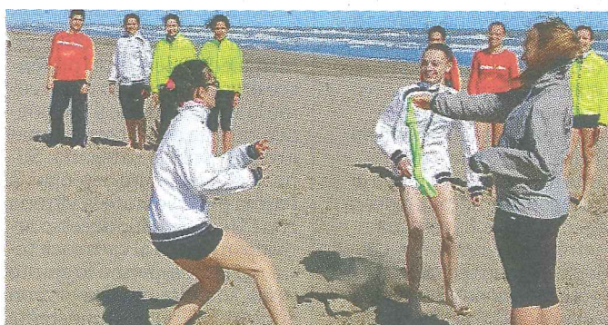
Per gli atleti allenamenti, studio e anche giochi da spiaggia

Lo "Spring Campus" di Atletica Estense chiude con grande successo la sua quarta edizione. Previsto in concomitanza con la prima parte delle vacanze pasquali ha come sede Riccione, che dispone dell'adeguata struttura sportiva oltre alla proverbiale ospitalità alberghiera romagnola. Coinvolti nel Campus 2015 erano trenta tesserati dai 12 ai 25 anni, coordinati dal team organizzativo di Stefano