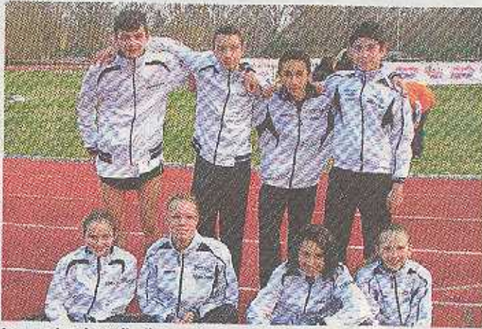
La squadra giovanile di mezzofondo dell'Atletica Estense

Nelle tre prove si sono ottimamente comportati nel confronto regionale con i rispettivi coetanei, riportando piazzamenti individuali anche importanti, ma è ancora presto per saltire singolarmente alla ribal-