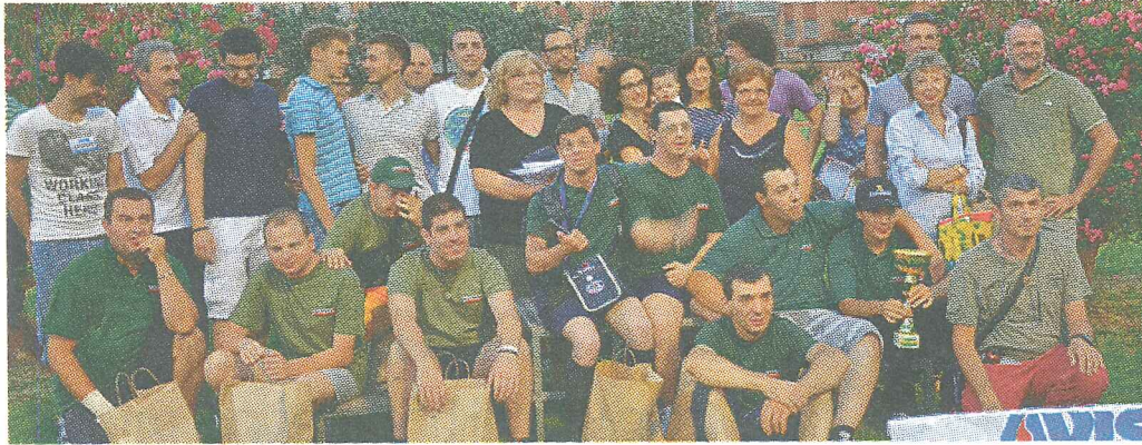
Gli atleti diversamente abili di Terra Ferma che hanno partecipato al Ferrarameeting