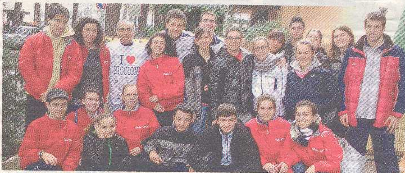
Il gruppo dell'Atletica Estense che ha partecipato allo Spring Campus di Riccione

Estense con i giovani allo Spring Campus di Riccione per un'esperienza unica