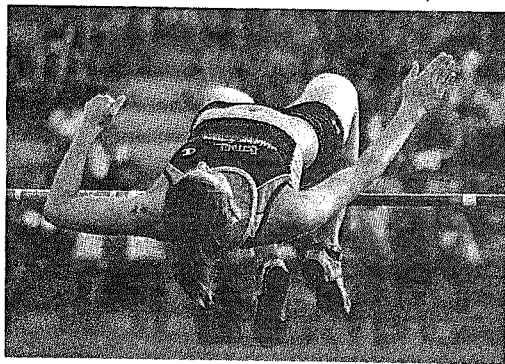
Un momento della gara di salto in alto femminile

La 18ª edizione è andata in scena al campo scuola con tre ore di gare appassionanti. Decisivo il supporto dell'Avis alla manifestazione, la solidarietà firmata Terra Ferma