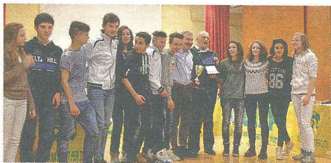
Una parte di ragazzi di Atletica Estense premiati dopo le campestri Uisp

Passione. Dignità. Buona volontà. Non bastano all'Atletica