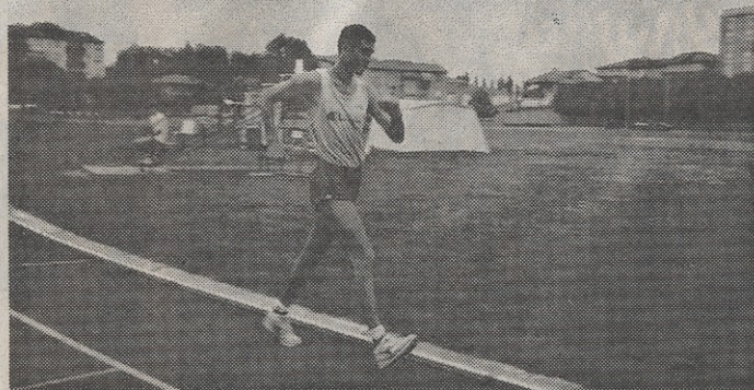
Stasera Ferrarammeeting apre con la marcia

Il programma Si apre con la marcia e i salti