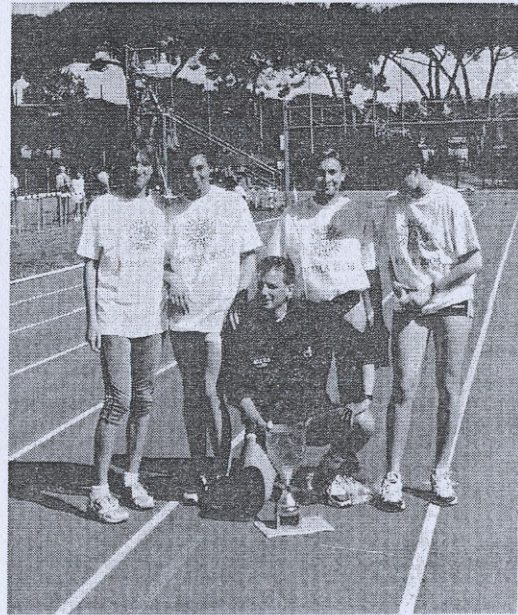
Gli atleti ferraresi (con allenatore) che gareggiano per l'Icel Lugo