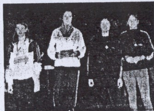
Il podio dei 100 m femminili