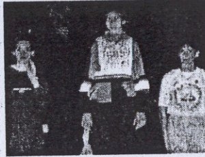
Il podio dell'alto femminile

16'51"1, ben coadiuvata dall'ucraina Iryna Yagodina, 2ª in 16'51"7. Tutte della Folgore Cona.